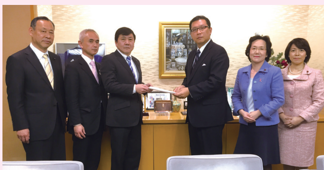
成澤区長に要望書を提出する公明党文京区議団

3月9日(水)、公明党区議団は、区長に対して、保育所待機児童解消に対する緊急要望を提出しました。