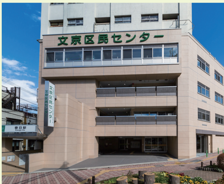
区民センター内の主な施設は右記の通りです。