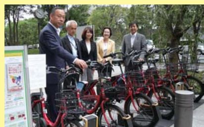
実証実験中の千代田区を視察