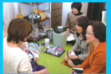
医療的ケア児のご家庭と意見交換をする区議団

答 区長：ライフステージに応じた、円滑かつ適切な支援体制を構築するため、保健・医療・障害福祉・子育て・教育等の、関係機関による協議の場で検討を進めていく。具体的な支援策についても、組織横断的に検討していく。