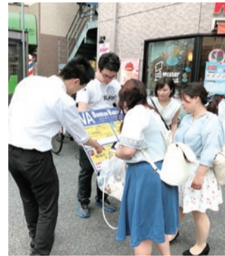
▲文京ボイスアクション街頭アンケートの様子

公明党文京総支部青年局は今年4月、若い世代の声を区政に届けるため青年世代や子育て世帯の区民を対象に区政に関する意識調査を実施しました。その結果を基に、特に関心の高かった①自転車駐輪場等の整備②出産・子育て支援③「Bーぐる」の路線拡充④無料Wi-Fiスポットの拡大——の4項目を政策案として取りまとめた上で、6月に「文京ボイスアクション(VA)」と銘打ち街頭アンケートを行い、533人の方からご協力をいただきました。