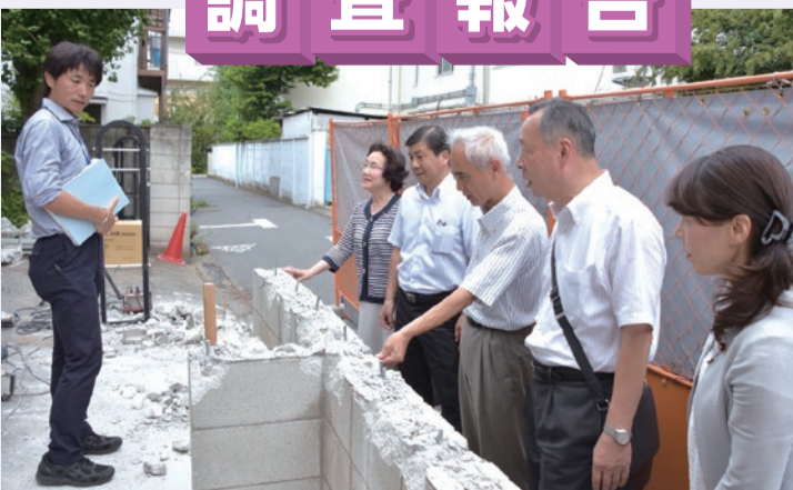
▲工事を視察する公明党文京区議団