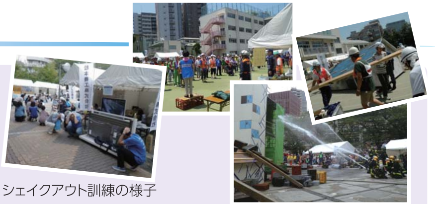
シェイクアウト訓練の様子

文京区地域防災計画に基づいて、区民のみなさんの防災意識を高め、災害時に区民・区民防災組織及び防災関係機関が協力して災害対策活動を円滑に行えるように総合的で実践的な防災訓練を実施します。